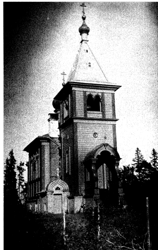
Храм Иоанна Предтечи

А непривычному к уединению, мирскому человеку, жутко на суровом, диком острове. Мрачно под мохнатыми лапами старых елей, пугают и воющий ветер, и тяжкие удары свирепых волн. Заброшенным, забытым, одиноким до отчаяния, казалось бы, должен чувствовать себя человек, особенно в темноте бесконечных осенних ночей или под стоны зимней вьюги. А вот живут и любят свой остров угрюмый, не могут расстаться с ним, тоскуют без него. И не один какой-нибудь неудачливый художник, а много их, и какие: Иоанн, Илия, Никита, Исая, Василиск, Авель, Мелетий, Аполлоний, Пионий и опять Иоанн, замыкающий шествие. Один за другим, как при горном восхождении, на протяжении столетия связаны