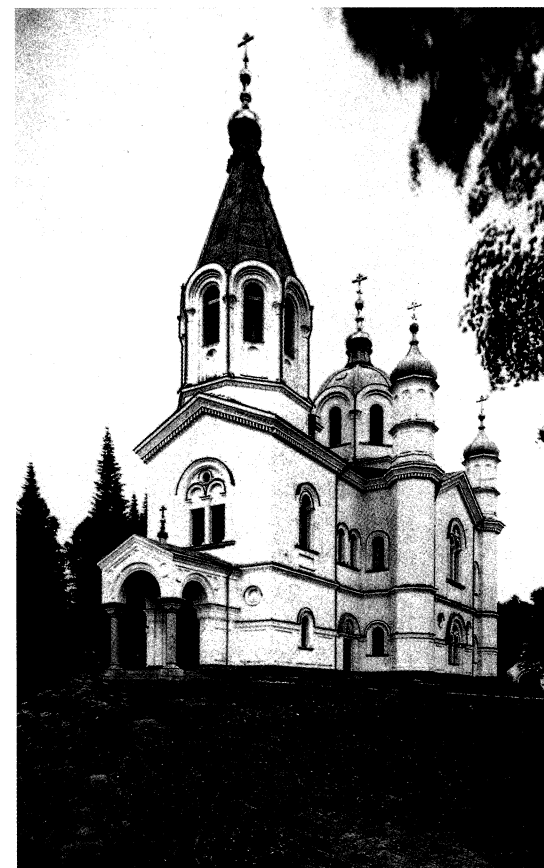
Скит Всех Святых. Нач. XX в.

чужом месте, среди иноверцев. Так он и не поехал. Болезнь усиливалась, но до самой смерти он остался и спокойным и в полной памяти.