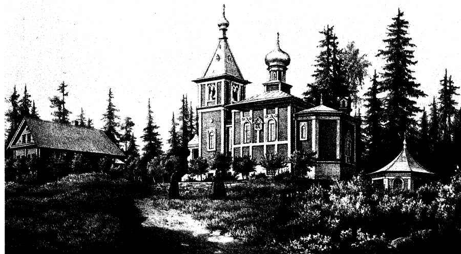
Предтеченский скит. Нач. XX в.