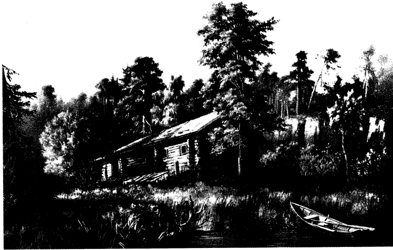
Пустынька игумена Дамаскина

ренномудрию, отрешаясь от мира, служил братству как «купленный раб», самоотверженно отдавался выполнению послушаний, отсекал свою волю, свое хотение 4 .