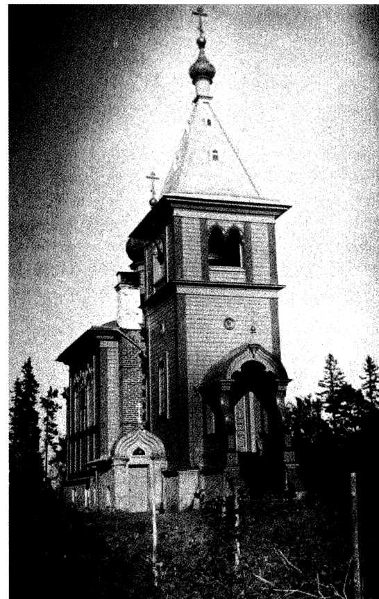
Храм Иоанна Предтечи

А непривычному к уединению, мирскому человеку, жутко на суровом, диком острове. Мрачно под мохнатыми лапами старых елей, пугают и воющий ветер, и тяжкие удары свирепых волн. Заброшенным, забытым, одиноким до отчаяния, казалось бы, должен чувствовать себя человек, особенно в темноте бесконечных осенних ночей или под стоны зимней вьюги. А вот живут и любят свой остров угрюмый, не могут расстаться с ним, тоскуют без него. И не один какой-нибудь неудачливый художник, а много их, и какие: Иоанн, Илия, Никита, Исая, Василиск, Авель, Мелетий, Аполлоний, Пионий и опять Иоанн, замыкающий шествие. Один за другим, как при горном восхождении, на протяжении столетия связаны